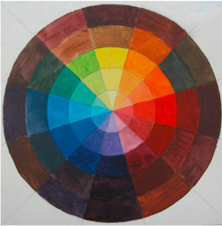
Kleurencirkel op toonwaardes